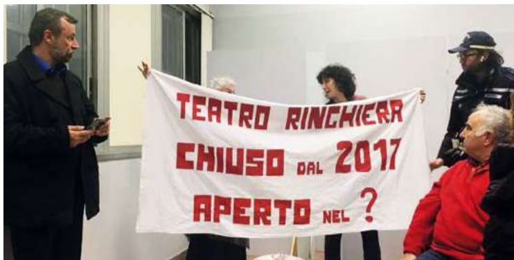
Ottobre '23, Municipio 5, cittadini chiedono di sapere quando sarà riaperto il teatro.

potrà accogliere il primo spettacolo nella primavera del 2026, esattamente nove anni dopo l'improvvisa chiusura "per problemi strutturali e di messa in sicurezza", avvenuta nell'autunno del 2017.