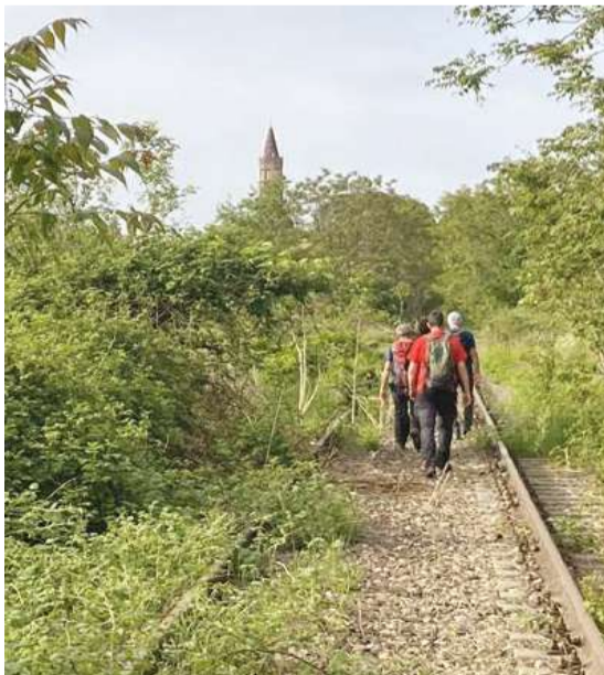
Chiaravalle, l'antica linea ferroviaria dismessa per Genova, nella tratta Rogoredo Chiaravalle Locate Triulzi.