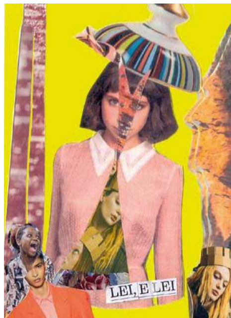
Lei, e Lei (2023).