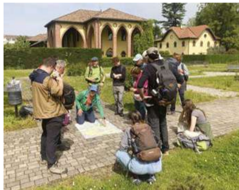
Gli esploratori al Castello Visconteo di Cassino Scanasio.

Dalla data di fondazione, avvenuta nel 2020 da una costola di Trekking Italia, Georama Esplorazioni Contemporanee ha