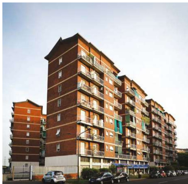
Gli edifici ex Enpam di via Valla.