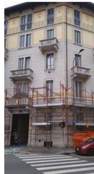
Lo stabile di via Costanza angolo via Gessi.

Diverso, invece, lo sbocco, almeno finora, che riguarda un'altra tranche del patrimonio ex Enpam messa sul mercato. Si tratta di un immobile residenziale situato in via Costanza angolo via Gessi (Municipio 6), venduto da Enpam al fondo Krialos e da questi ceduto all'immobiliare Gran Costanza. Edificio storico di un certo pregio, si sviluppa su sei piani (uno interrato e cinque fuori terra), per un totale di 68 appartamenti.