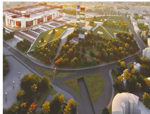
Sopra il render di una ipotesi di riqualificazione dell'area circostante. A sinistra, l'interno dello stadio, con il nuovo anello di servizi, da ricavare tra il primo e secondo anello.