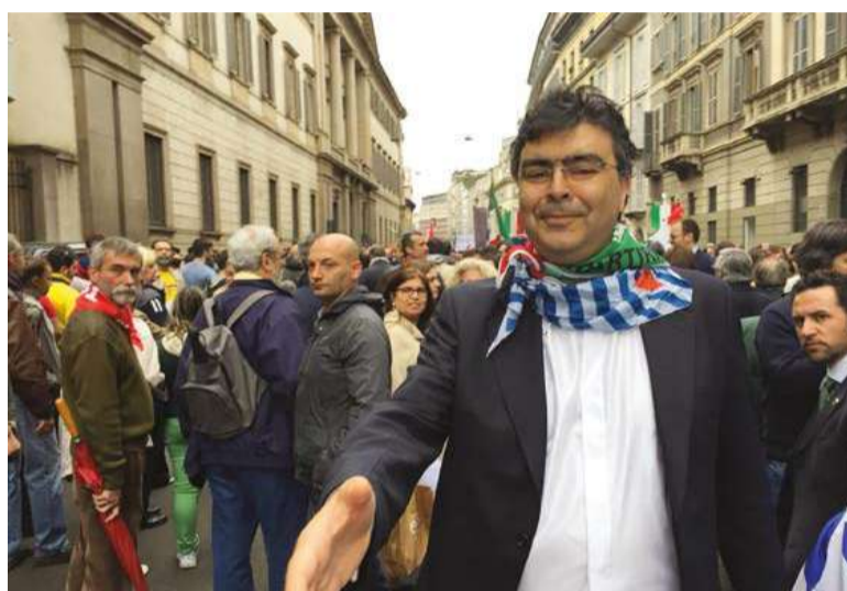
Nelle foto: sopra, 16 novembre 2023, Memoriale della Shoah, Milano - Emanuele Fiano presenta il suo libro "Sempre con me: la lezione della Shoah" insieme alla senatrice Liliana Segre; sotto, Emanuele Fiano a una manifestazione del 25 aprile, con al collo i fazzoletti di Aned e Anpi.