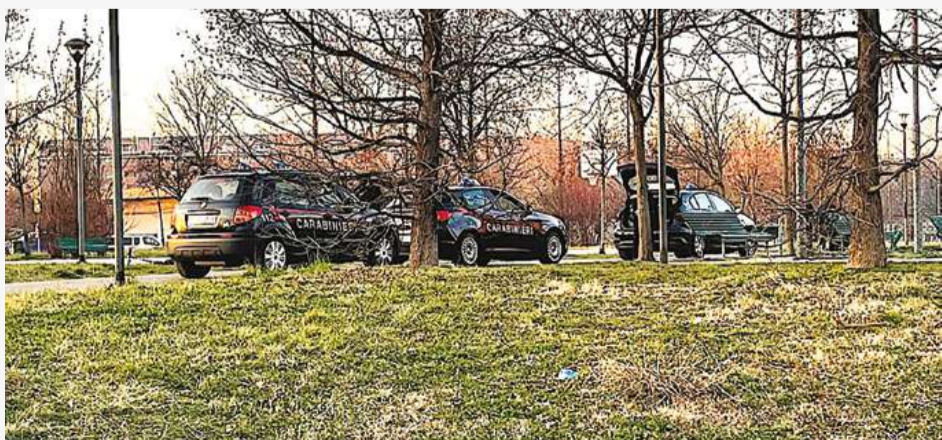
Auto dei Carabinieri che pattugliano il quartiere Torretta-Caimera.

La speranza è che da questo incontro si escano decisioni operative, una prima risposta al Che fare? che segni una svolta nella vita del quartiere.